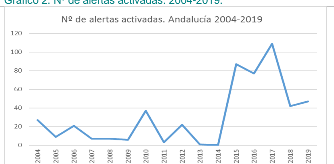
Gráfico 2. Nº de alertas activadas. 2004-2019.

Fuente: Servicio de Vigilancia y Salud Laboral. Consejería de Salud y Familias